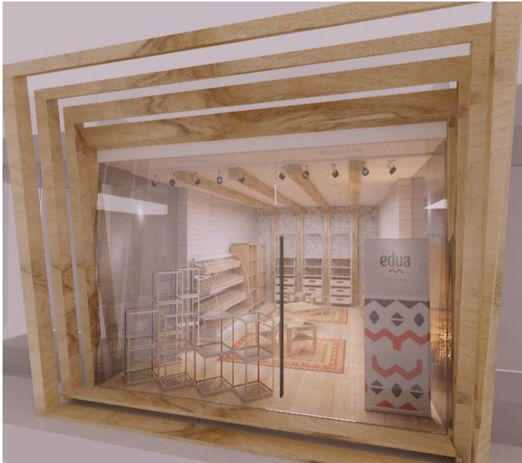
Pamje ballore e dyqanit